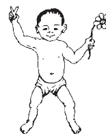
OI howply dermanlary kabul etmeýär. OI yöne oňat naharlanýar, miwe suwuny içýär, oňat dynç alýar.

Antibiotikler adaty sowuklamada peýda etmeýärler. Antibiotikleri diňe olaryň kömek edip bilýän infeksiýalarynda ulanyň.